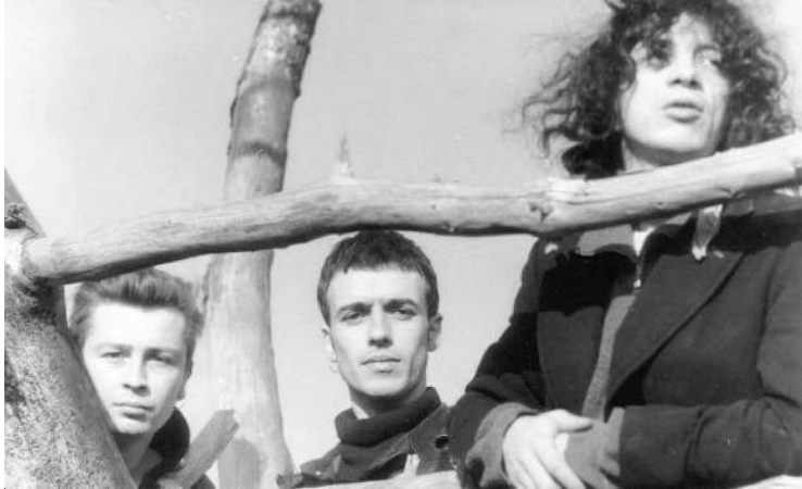
Blindfolded, un power-trio implacable

Mush chérissait les Who, sonnait grunge en français, ce qui leur permit de beaucoup jouer et de publier deux CD. Jerky Turkey maniait l'urgence punk, pour le